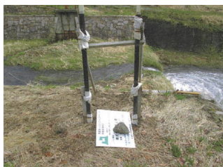
①活動実施前の状況